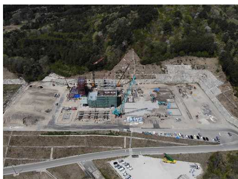
発電所建設工事全景（4月下旬）