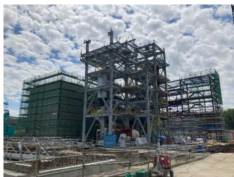
タービン棟（左側） ボイラエリア（中央）