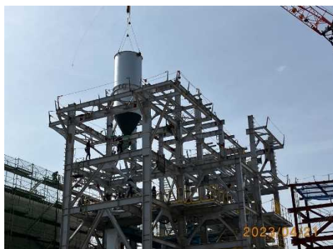
タンクの取付作業