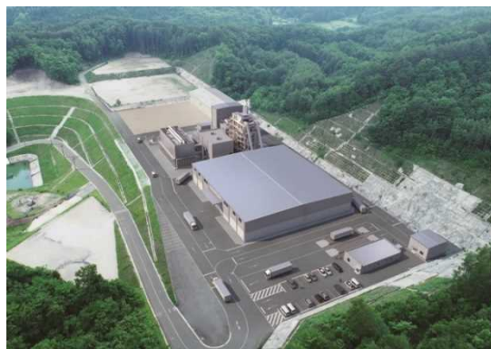
飯館みらい発電所完成予想図

飯館みらい発電所は、蕨平地区で林業の間伐材や製材所などから出る樹の皮（バーク）などの木質燃料を燃やして電気を作る施設（バイオマス発電所）です。現在、事業の開始に向け安全第一で建設工事を行っています。「飯館みらい発電所通信」は、工事の様子や安全活動の状況など情報をお届けします。