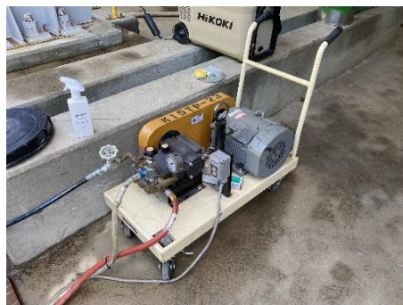
試験用仮設昇圧ポンプ ボイラや配管を試験用の圧力にする装置