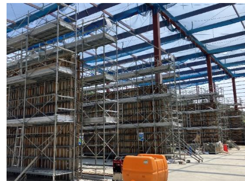
チップ貯留棟内部の仕切壁