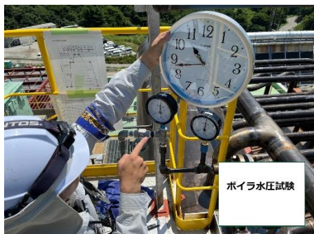
ボイラ水圧試験の様子 所定の圧力を保持しているか確認します