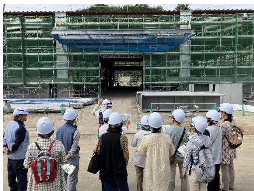
ハートインフラワー様

おかげさまで飯館みらい発電所に高い関心をお寄せいただき、村内の団体様などに工事の様子をご視察いただいています。引き続き安全第一で工事を進めてまいります。