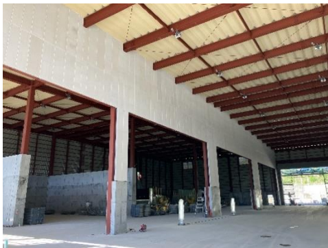
チップ貯留棟内部