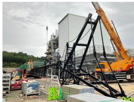
重量機器類の搬入終了に伴う 120トンクローラクレーン解体作業