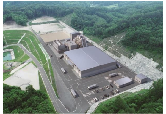
飯舘みらい発電所完成予想図

飯舘みらい発電所は、蕨平地区で林業の間伐材や製材所などから出る樹の皮（バーク）などの木質燃料を燃やして電気を作る施設（バイオマス発電所）です。現在、事業の開始に向け安全第一で建設工事を行っています。「飯舘みらい発電所通信」は、工事の様子や安全活動の状況など情報をお届けします。