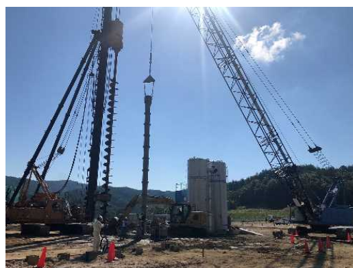
杭（くい）打ちの様子