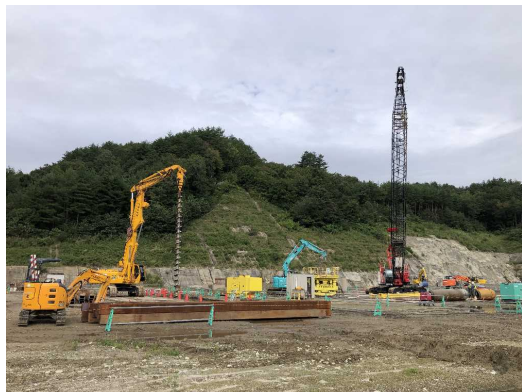
地盤改良工事の様子