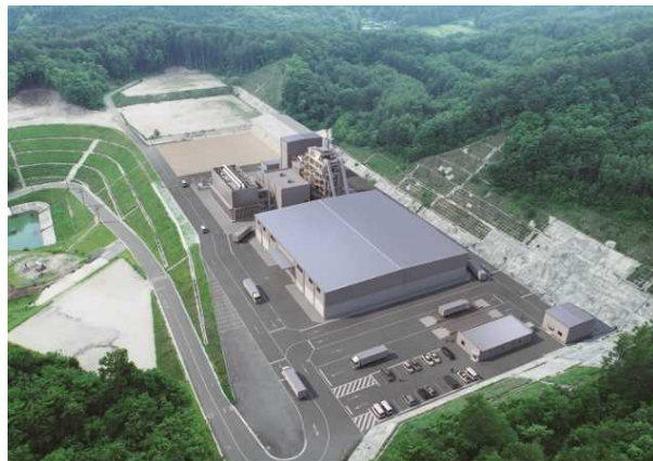
飯舘みらい発電所完成予想図

ここ飯舘村で皆さまのお役に立てるバイオマス発電の実現に向け努力してまいります。どうぞよろしくお願いいたします。